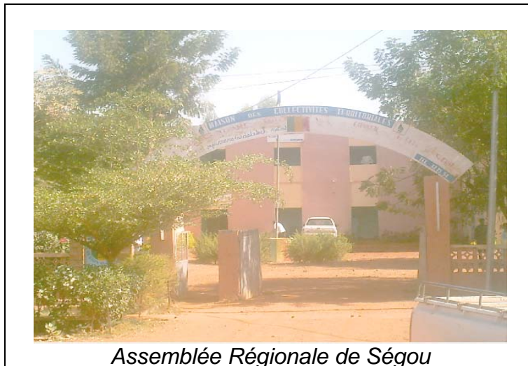
Assemblée Régionale de Ségou

La rencontre de Ségou s'est tenue le Mardi 28 Février 2006 dans la salle de délibération de l'Assemblée Régionale, en présence d'une vingtaine de participants.