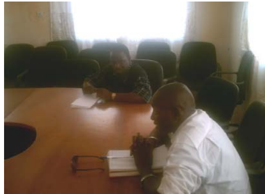
Rencontre d'information et de concertation du RIOEV dans la Région de Kayes

Le Président de l'Assemblée Régionale, avant d'offrir un déjeuner à tous les participants de la rencontre de Kayes, a tenu à préciser que la richesse des débats était due à la pertinence du sujet car « venir en aide aux OEV est une action noble », et qu'il ne ménagera aucun effort pour la réussite de ce Programme dans la région de Kayes.