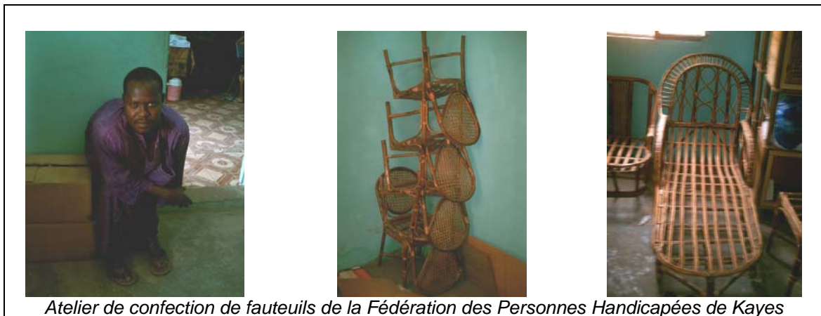
Atelier de confection de fauteuils de la Fédération des Personnes Handicapées de Kayes