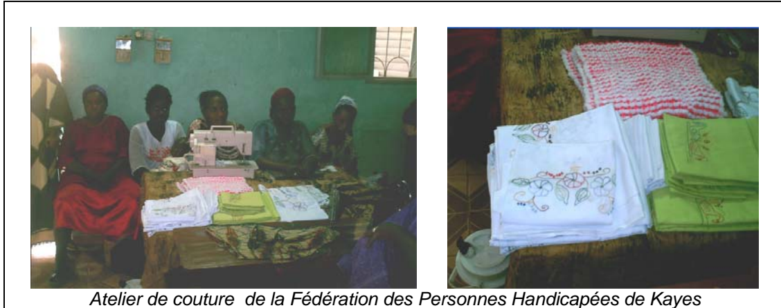
Atelier de couture de la Fédération des Personnes Handicapées de Kayes