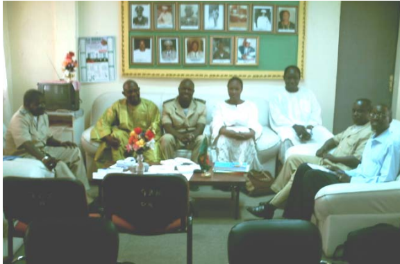
Visite de courtoisie de la mission chez le Gouverneur de Kayes

La mission a commencé par une visite de courtoisie au Gouvernorat de la région de Kayes où l'équipe a été reçue par le Gouverneur, son Conseiller au Développement, et son Conseiller aux Affaires administratives et juridiques.