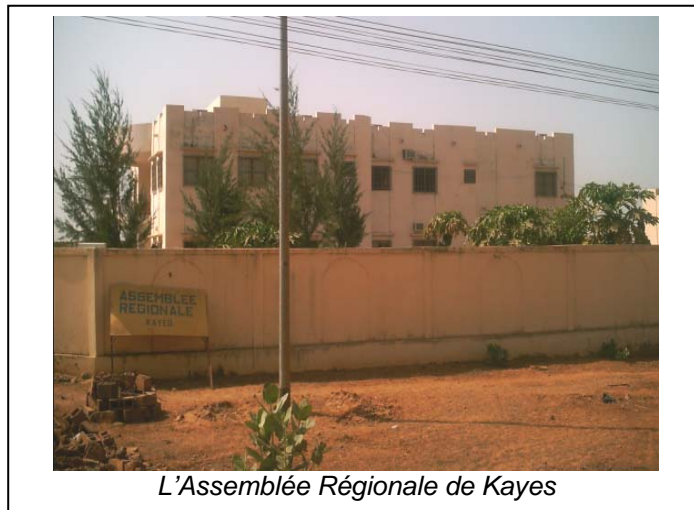
L'Assemblée Régionale de Kayes

Le Mercredi 29 Mars 2006, une mission du RIOEV a tenu une journée de travail à Kayes dans le cadre de « la rencontre d'information et de concertation du Réseau des Intervenants auprès des Orphelins et autres Enfants Vulnérables dans la région de Kayes ».