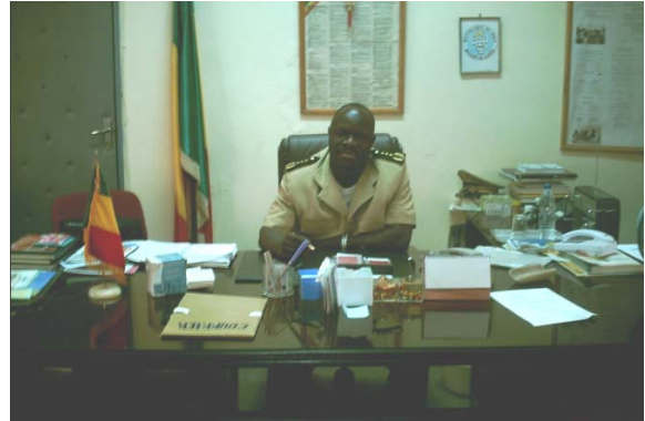
Le Gouverneur de Kayes

Après une brève présentation du « Réseau des Intervenants auprès des Orphelins et autres Enfants Vulnérables », des orientations du Programme Fonds Global en faveur des OEV, et des mécanismes de mise en œuvre au niveau régional, la mission a d'une part souhaité que la question relative aux OEV soit une priorité pour les premiers responsables de la région, et d'autre part a sollicité l'appui et le soutien de ceux-ci dans la réussite du Programme.